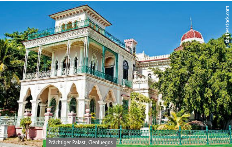
Prächtiger Palast, Cienfuegos