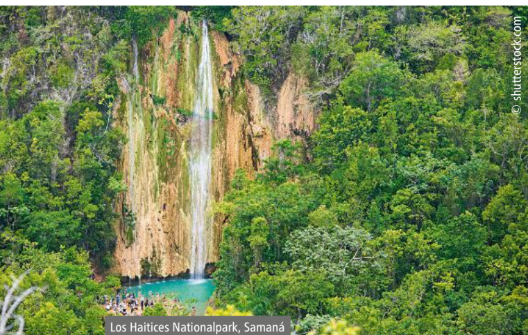
Los Haitices Nationalpark, Samaná

Karibik-Feeling unter Palmen 07.03. – 17.03.2019 11 Tage