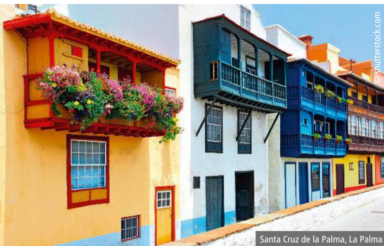
Santa Cruz de la Palma, La Palma