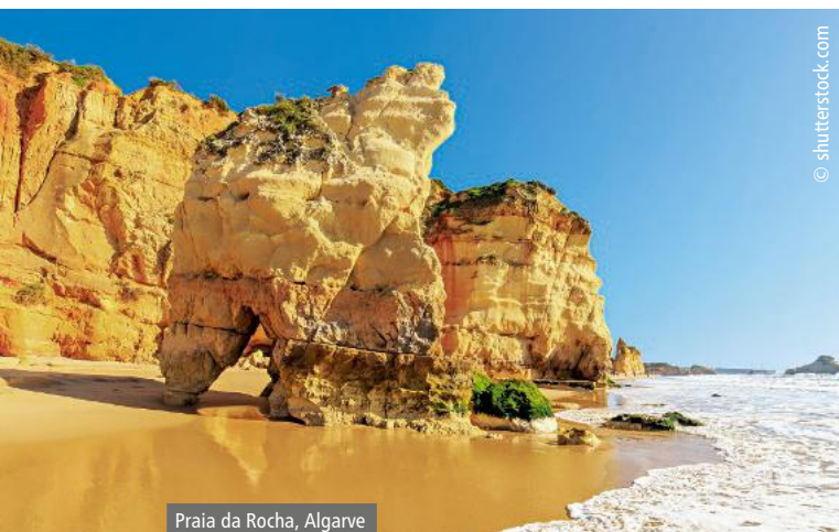
Praia da Rocha, Algarve