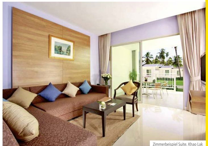
Zimmerbeispiel Suite, Khao Lak