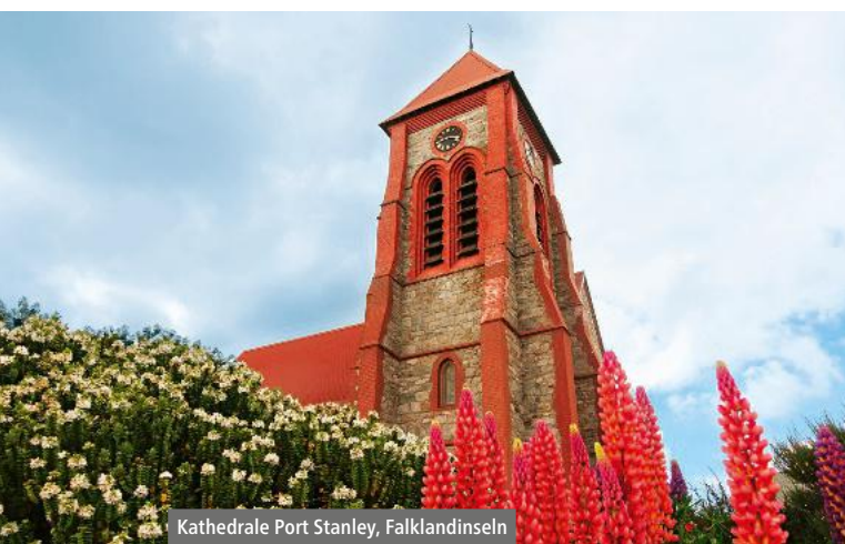
Kathedrale Port Stanley, Falklandinseln