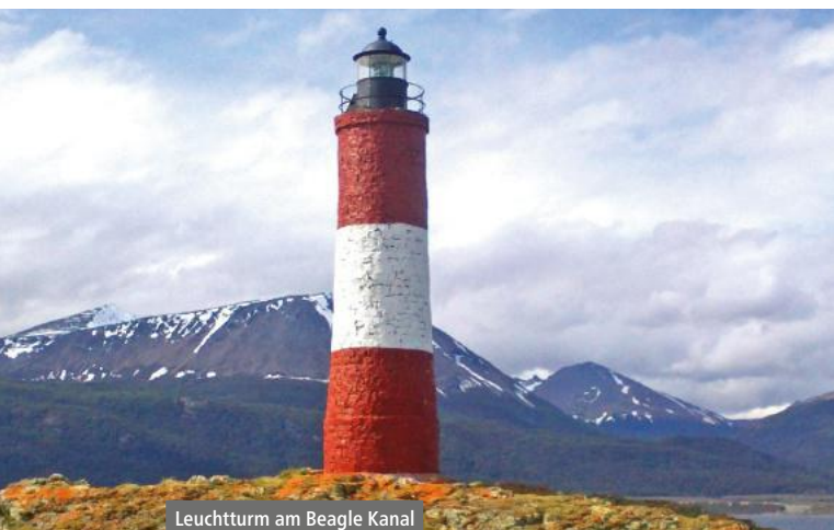
Leuchtturm am Beagle Kanal