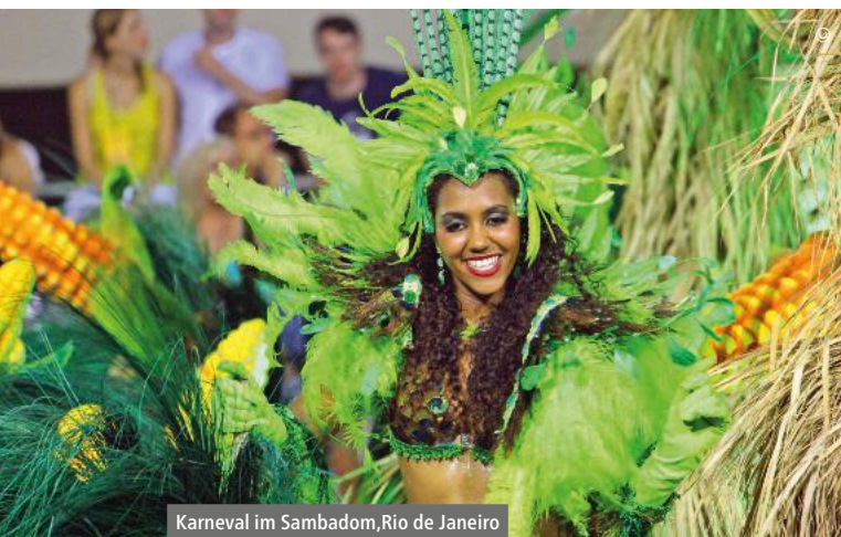
Karneval im Sambadom, Rio de Janeiro

Zum Karneval nach Rio 15.02. – 04.03.2020 19 Tage